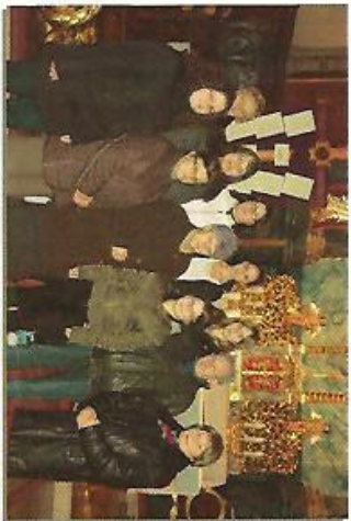
Członkowie Kregu biblijnego