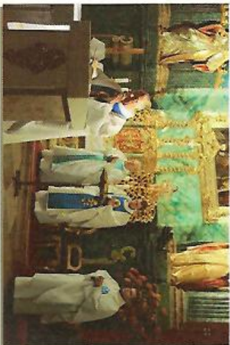
Spotkanie w salce poprowadziła uroczysta Msza Św.