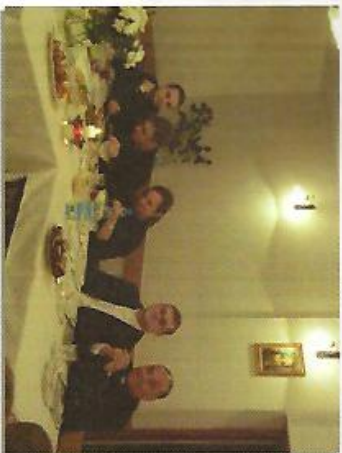
Po Mszy Św. była okazja do spotkania się z księżmi, którzy służą w naszej parafii.