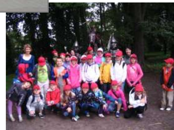
W czasie wycieczki szlakiem piastowskim dzieci zwiedziły średniowieczny gród Mieszka I na Ostrowie Lednickim