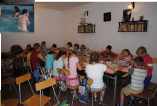
W salkach dzieci wykonywały laurki dla Pana Burmistrza