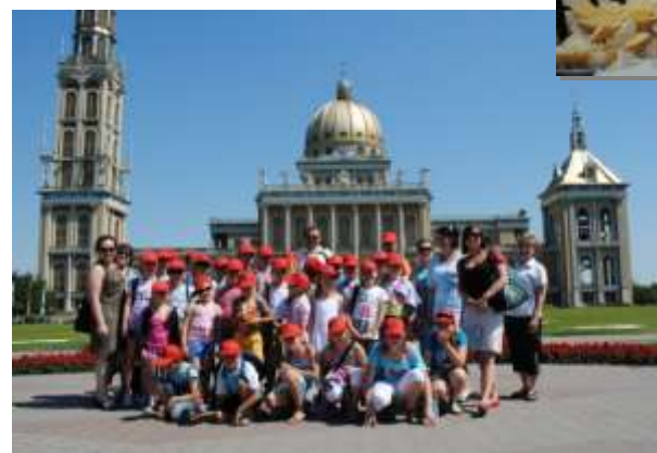
W czasie dwutygodniowych półkolonii dzieci odwiedziły także Licheń