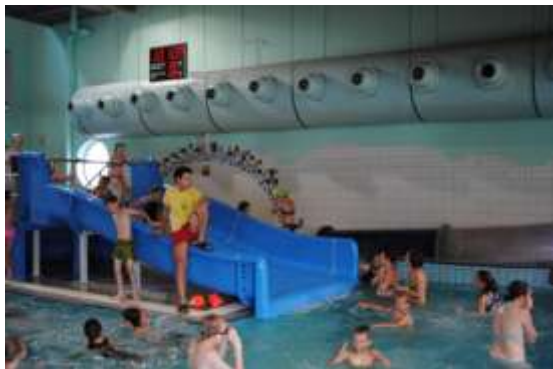
Na basenie w Kościanie dzieci przeżyły fantastyczną wodną przygodę i nikt się nie utopił ☺